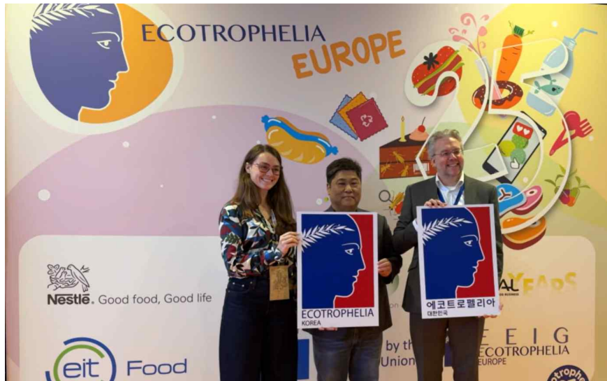
ECOTROPHELIA KOREA 발족